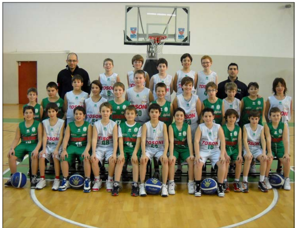
il gruppo degli Aquilotti NBA